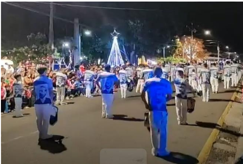
"Iluminación del árbol de Navidad 🌲"